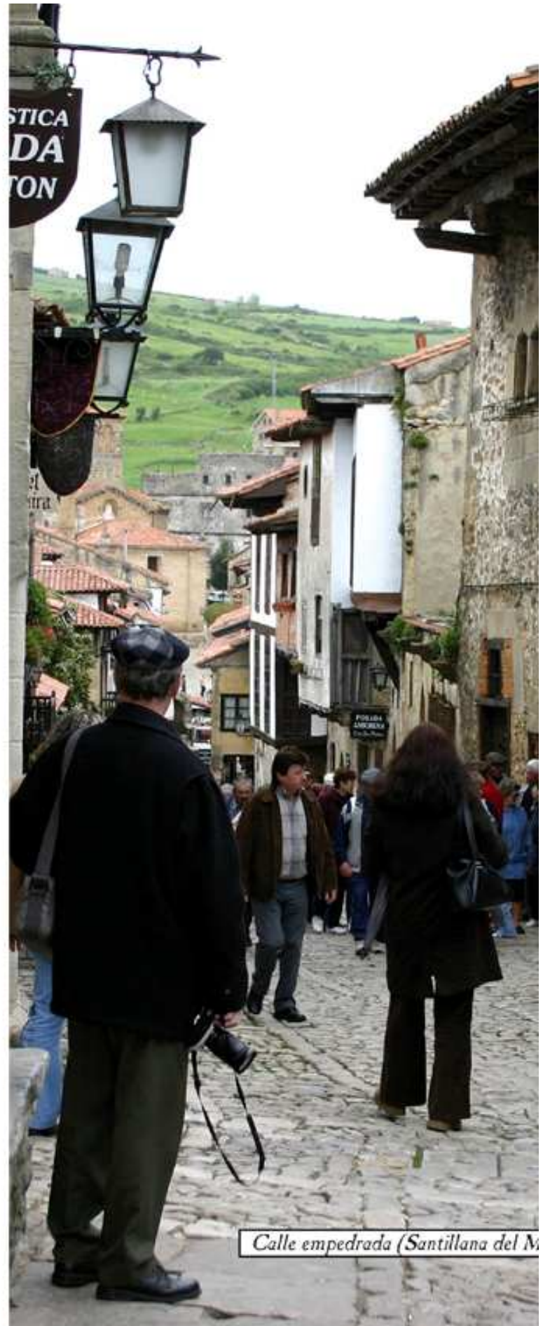
Calle empedrada (Santillana del Mar)

Podrás pasear por una selva Tropical entre cientos de mariposas o visitar un Parque temático (renos, bisontes...)