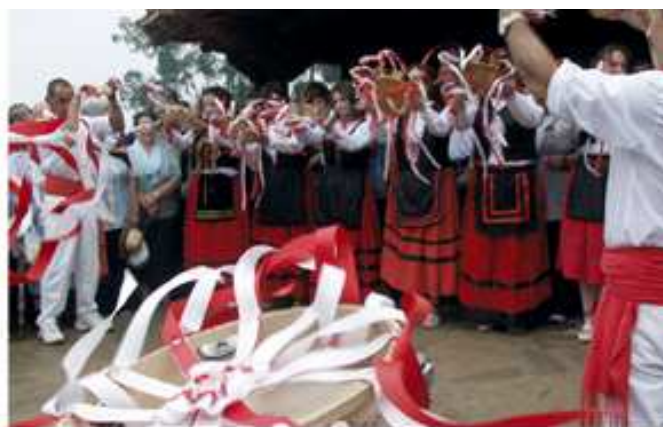
Fiesta de San Cipriano en Cohicillos (Cartes)

Cada pueblo honra a su patrón o patrona con típicas verbenas, romerías y actos lúdicos, muchos de ellos con cientos de años de tradición, pero son la Cabalgata de Reyes en Santillana del Mar (5 de enero), San Benito en Barcenaciones (11 de julio)