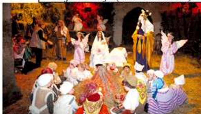
Cabalgata de Reyes (Santillana del Mar)

y San Cipriano en Cohicillos (16 de septiembre) las fiestas de la mancomunidad que están catalogadas como Fiestas de Interés Regional y el día 28 de julio se celebra el Día de Las Instituciones en Puente San Miguel.