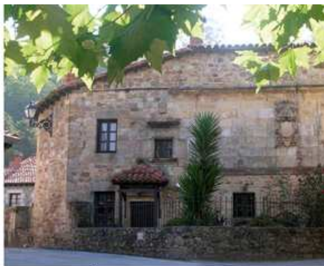
Casa blasonada de Barcenaciones (Reocín)

El municipio de Cartes también posee dos magníficos Conjuntos Históricos declarados Bien de Interés Cultural localizados en Cartes y Riocorvo . En Cartes todas las casas se organizan en torno a una calle (Camino Real) en ella nos encontramos la Casa Obregón , la Casa de los Oviedo , la Casona del Capitán Velarde ... Riocorvo se asienta, al igual que Cartes, a lo largo del antiguo camino que unía Reinoso con la costa cantábrica. Cuenta con varias edificaciones de gran interés, entre ellas se cuentan la Casa de Velarde , del siglo XVII, reformada posteriormente (consta en obras en 1752); la Casa Palacio de los Alonso Caballero , un edificio de tres alturas y planta rectangular, ornado con los escudos de la familia Alonso, cuya construcción se remonta a mediados del siglo XVIII; y la llamada " Casa de los púlpitos ", también del siglo XVIII.