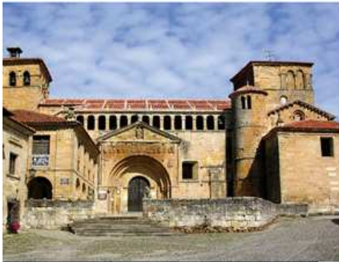
Colegiata de Santa Juliana (Santillana del Mar)

Junto a ésta, se encuentra la Colegiata de Santa Juliana en Santillana del Mar. Ya en el siglo IX unos monjes que trajeron las reliquias de Santa Juliana debieron levantar una ermita y monasterio aquí. Con el apoyo nobiliario, se convirtió en la abadía más importante de Cantabria en la Edad Media. De aspecto monumental al exterior, está construida en sillería arenisca. Se le añadieron en los siglos XVI-XVII algunas construcciones, como la logia sobre el muro sur, la sacristía y la casa del abad, que han logrado adaptarse perfectamente al espíritu medieval del monumento.