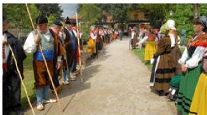
Día de Las Instituciones (Puente San Miguel)

Cada pueblo honra a su patrón o patrona con típicas verbenas, romerías y actos lúdicos, muchos de ellos con cientos de años de tradición, pero son la Cabalgata de Reyes en Santillana del Mar (5 de enero), San Benito en Barcenaciones (11 de julio)