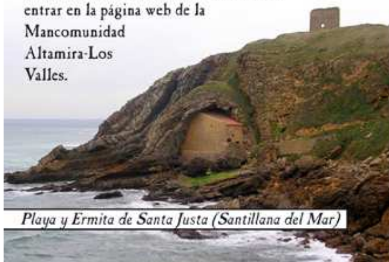
Playa y Ermita de Santa Justa (Santillana del Mar)

Aparte de estas tres rutas existen en la mancomunidad otras nueve. Para más información entrar en la página web de la Mancomunidad Altamira-Los Valles.