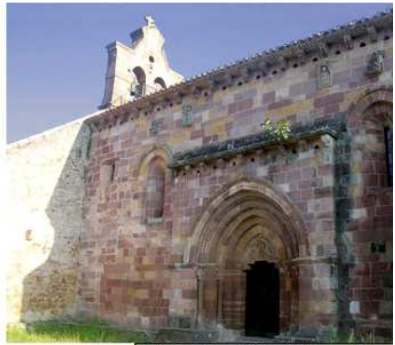
Iglesia de Santa María de Yermo (Cartes