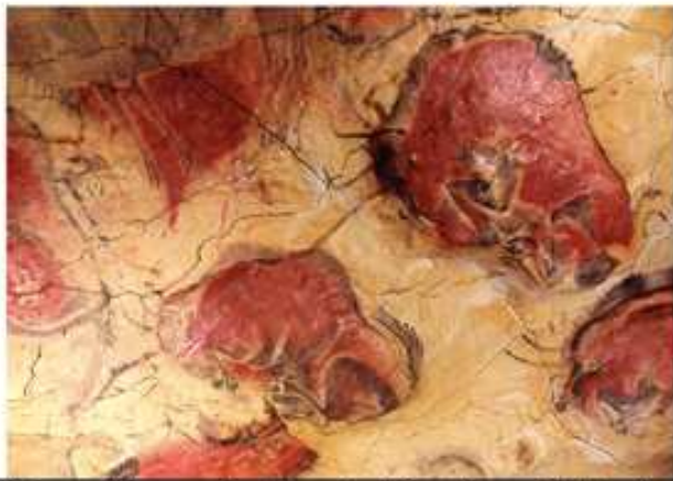
Bisonte, Cuevas de Altamira (Santillana del Mar)

La presencia humana en la Mancomunidad se remonta a la época prehistórica, como así lo atestiguan los restos encontrados en las Cuevas de Altamira en Santillana, en la Cueva de la Estación y Santa Clotilde en Quijás y en la Cueva del Gurugú en Bedicó. De todas ellas, la Cueva de Altamira es la más conocida, pues es considerada como la " Capilla Sixtina del Arte Rupestre ". En su interior aparecen pinturas, huesos, ornamentos cerámicos... como testigos de la estancia en ellas de nuestros antepasados.