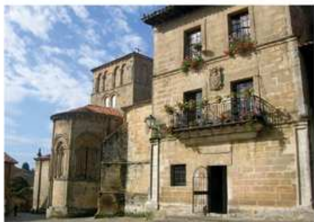
Plaza de las Arenas (Santillana del Mar)

En la villa de Santillana del Mar, en la calle de Santo Domingo nos encontramos enseguida a mano izda. el Palacio de Peredo-Barreda (actual sede de Caja Cantabria) y a mano derecha la Casa de los Villa . Un poco más adelante, la calle se bifurca. Hacia la izquierda, la calle Juan Infante, flanqueada por viviendas balconadas llenas de flores, desemboca en la Plaza Mayor, uno de los rincones más representativos de la villa. En ella nos encontramos las Casas del Aguila y la Parra , delante de las que se levanta la estatua del bisonte de Altamira. Frente a ambas se encuentra el Parador Gil Blas , antiguamente la Casa de los Barreda . A pocos metros se encuentra el Ayuntamiento. En la calle Carrerasc se levanta la Torre de Velarde , y a nuestra izda. por la calle Cantón pasaremos ante el Palacio de Valdivieso del siglo XVIII, hoy hotel. A ambos lados de esta calle, se levantan numerosas casas típicas del pueblo como la Casa de Leonor de la Vega y junto a esta está la Casa de los Hombrones . Por la calle del Río descenderemos hasta encontrarnos a mano dcha. con las Casa de los Cossio y Quevedo , frente a ellas la Casa de los Abades y cerrando la perspectiva la hermosa Colegiata de Santa Juliana . La Villa de Santillana del Mar está calificada como Conjunto Histórico Artístico desde 1889.