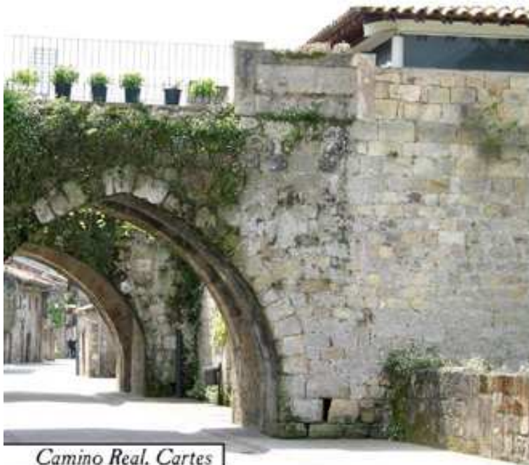
Camino Real. Cartes

Además posee dos magníficos conjuntos históricos declarados Bien de Interés Cultural, que se localizan en los términos de Cartes y Riocorvo desde 1985 y 1981 respectivamente.