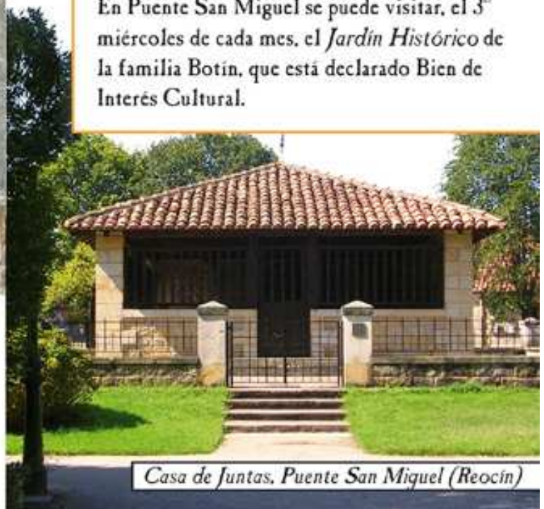
Casa de Juntas, Puente San Miguel (Reocín)

En Puente San Miguel se puede visitar, el 3 er miércoles de cada mes, el Jardín Histórico de la familia Botín, que está declarado Bien de Interés Cultural.